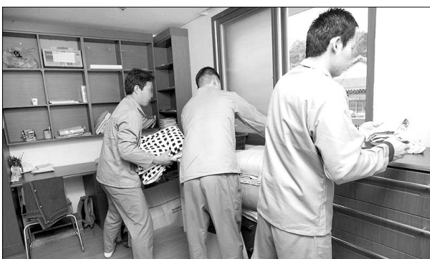
의정부 교도소 재소자들이 3월 22일 선재동자원을 찾아 불맞이 대청소를 하고 있다.