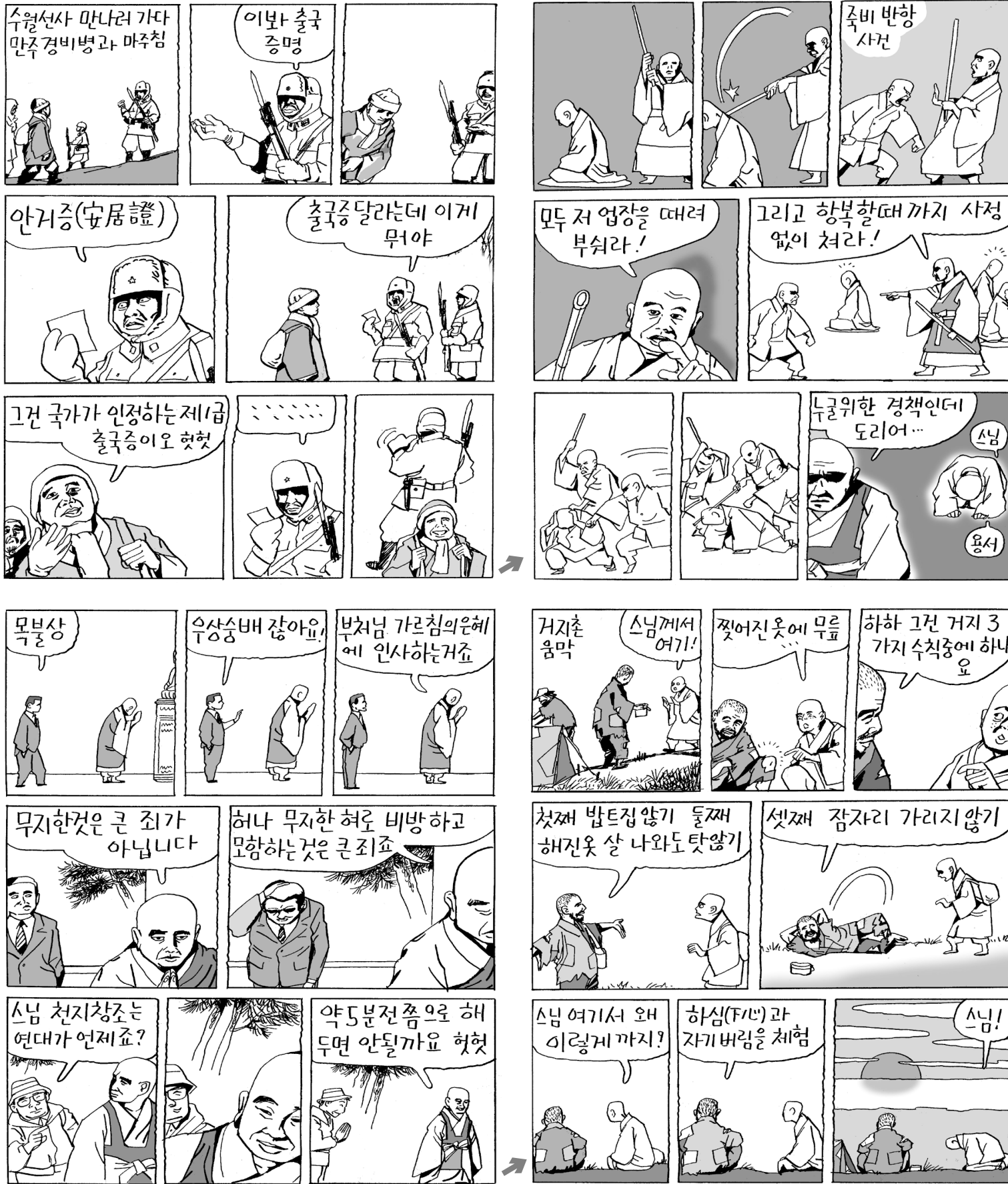
금오 스님 (1896~1968): 전남 강진 생. 16세에 월정사서 득도. 직지사·쌍계사 등서 조질을 지냈으며 1955년 조계종 부종정에 추대됐다. 1954년 이후 '정화'에 주력했다.

선재동자는 선지증에동자로부터 마가다국의 한 부락에 있는 바다나라라고 하는 성(城)에 살고 있는 현승(賢勝)우바이를 찾아가 보살행을 배우고 보살도를 뒤는 법을 물으라고 하는 가르침을 받았다. 현승우바이를 찾아가 예배하고 나서 가르침을 청하자, 그녀는 다음과 같이 대답하였다.