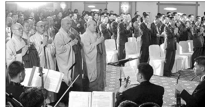
국군불교총신도회는 3월22일 열린 창립 4주년 기념법회에서 통합홈페이지 구축 등 조직활성화 대책을 밝혔다.