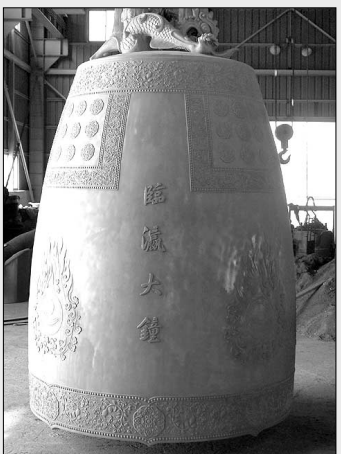
6월경 강릉시청 앞 공원에 설치될 ‘강릉 시민의 종’

원광식 사장 10년 연구 한국만의 전통주조법 활용 ‘강릉 시민의 종’으로 명명