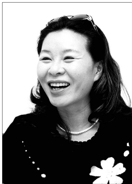
관세음보살님 한 번 외치고, 살려주세요 매달리면서 겨우겨우 일어난다. 천천히 가면 모든 것을 이룰 수 있다.”

“소원성취를 하려면 간절하게 기도해야 한다는데 나는 왜 이렇게 아무 생각이 없지? 숫자를 세면서 ‘참회합니다’만 반복한다. 그러다가 숫자마저도 놓는다.” “터져 나오는 한숨소리 마크로 입술을 막려고