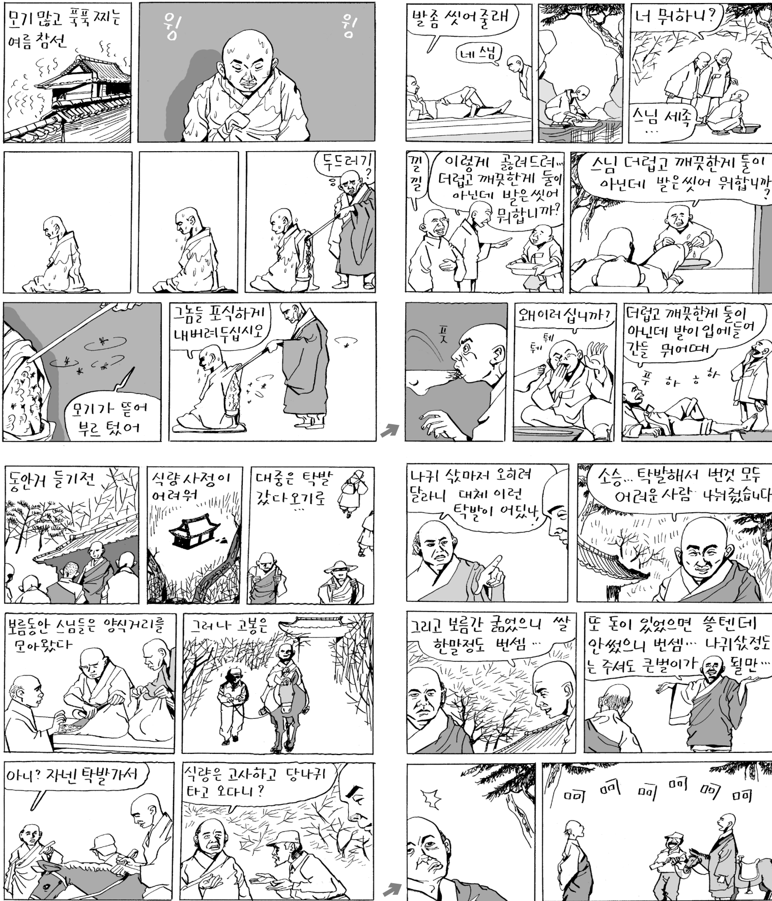
고봉 스님(1901~1969): 황해도 장연 생. 25세에 서울 대각사에서 용성 스님에게 출가. 망월사에서 만일결사정진. 제방선원서 정진후 경전공부, 통도사·해인사 등서 강사.

마야부인의 가르침에 따라 선재동자가 찾아가는 선지식은 천주광녀(天主光女)다.