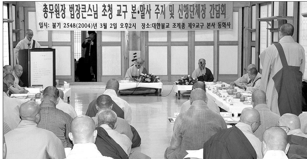
처음 시도되는 총무원장 법장 스님 초청 교구본말사 주지사님 및 실행단체장 간담회에서 건의와 의견수렴이 활발히 이뤄졌다. 3월 2일 조계종 제9교구본사 동화사에서 열린 간담회.

조직 체계의 확대·개편과 함께 학예직 증설 등 문화재 담당자의 전문성도 강화되어야 한다. 그동안 문화재 전문가들은 문화재청의 인적 구성이 행정직 중심이어서 집행기능 위주로 조직이 운영돼 왔다는 문제점을 지적해왔다. 이번 문화재청 차관청 승격은 문화유산 보존·관리를 강화할 교두보에 틀림없다. 그러나 많은 전문가들은 문화재청이 '겉껍데기만 차관청'이 되지 않도록 내실을 기하라고 충고한다. 차관청 승격에 따른 인력 확보, 기구 확충, 고급 정책 생산, 예산 확보가 반드시 뒷받침돼야 한다는 것이다. 오유진 기자 e_exist@buddhapia.com