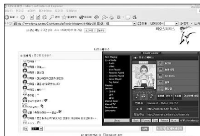
매일밤 열리는 명상대화방.