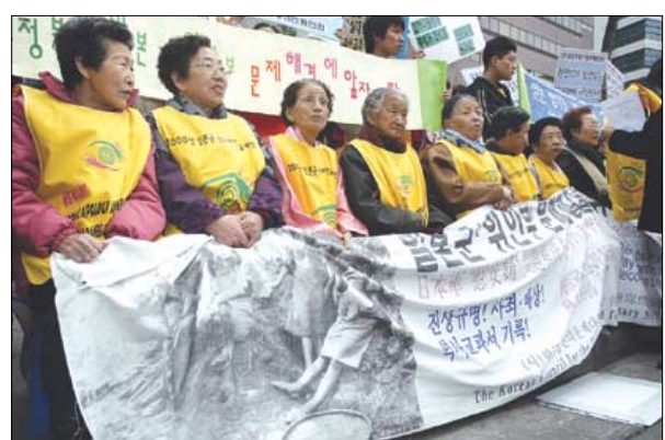
경기도 광주= 김철우 기자

못다 핀 꽃을 다시 불교로 피우겠다는 할머니들. 원망과 억울함을 넘어 스스로 치유하는 삶은 바로 불교였다고 말했다.