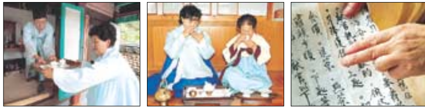
정성껏 우려 제상에 올린 차는 제사가 끝난 후 노중부와 차종부가 음복한다. 제사순서를 적어놓은 율기에 올린다. 점다의 순서가 적혀 있다.(사진 왼쪽부터)