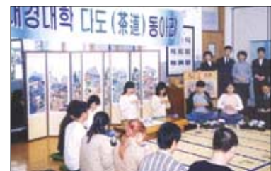
대경대 다도 동아리 모임.

'차문화 교육현장' 코너에서는 지난 1월부터 전국 대학에 개설된 차 관련학과들을 소개했다. 1월 7일 소개된 원광디지털대학 차문화경영학과를 시작으로 성신여대 예절다도학과, 부산여대 차문화복지학과, 성균관대 예절다도학과, 한서대 차학전공에 이르기까지 우리 차 문화를 알리고 전문가를 양성하고 있는 현장 5 곳을 탐방해 보았다.