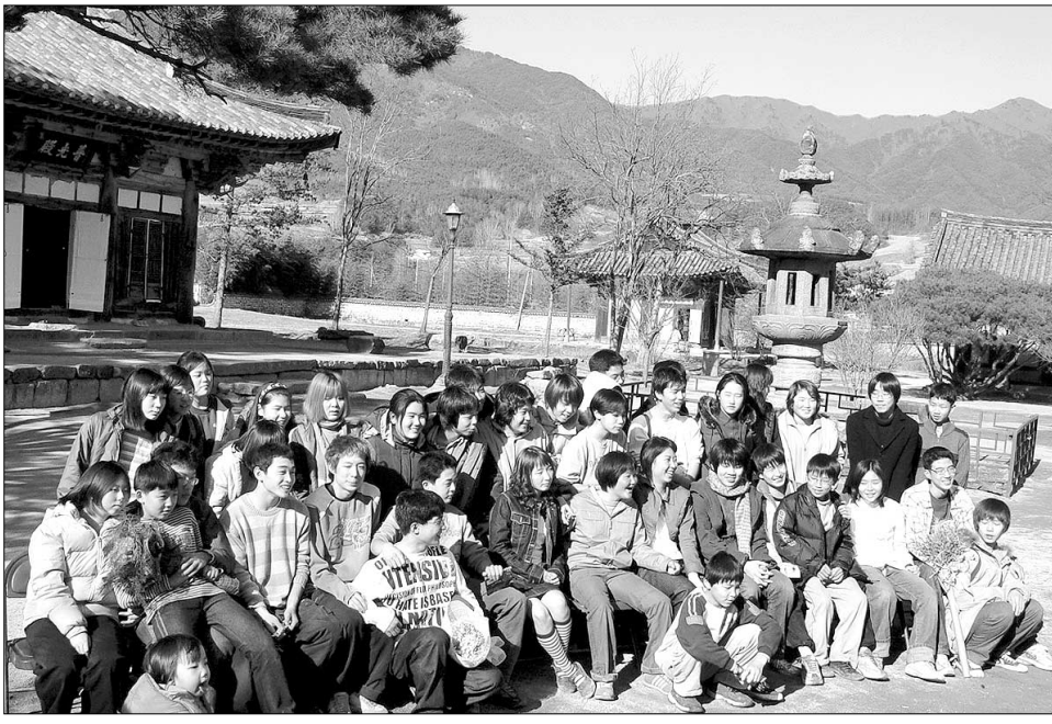
작은학교 졸업생들과 재학생들이 졸업식이 끝난 뒤 함께 기념촬영을 하며 활짝 웃고 있다.