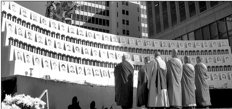
2월18일 '2·18 대구지하철 참사희생자 1주기 범시민 추모식'에서 동화사 스님들이 반야심경을 봉독하며 고인들의 극락왕생을 발원했다.