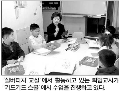
'실버티처 교실'에서 활동하고 있는 퇴임교사가 '키드카드 스쿨'에서 수업을 진행하고 있다.

영어동화 구연, 수학, 명심보감, 아동미술, 토론, 논술 등 매일 강의내용이 달라지는 방과후 교실이 있다. 사회복지법인 '실버티처 교실'에서 활동하고 있는 퇴임교사들이 '키드카드 스쿨'에서 수업을 진행하고 있다.