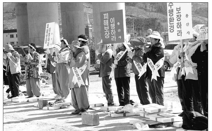
청도 용산사 스님과 신도 50여명이 2월18일 공사현장에서 대구-부산간 고속도로 공사중단을 촉구하는 시위를 벌이는 모습.

일연선사가 삼국유사를 저술한 장소인 군위 인각사도 인근지역에 화북댐이 건설함에 따라 훼손 위기에 처하게 됐다.