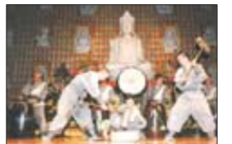
'이단법석'의 한 장면.

'사랑모아 희망 만들기' 서울 삼전종합사회복지관은 3월 6일 송파구민회관 예술극장에서 '2004 사랑모아 희망 만들기' 행사를 개최한다. 이번 행사는 불교와 타교의외의 만남 타악 뮤지컬 '이단법석'의 공연, 삼전복지관 풍물패 축하공연 등 다채로운 프로그램들이 진행된다. (02)421-6077 '우리 졸업, 축하해 주세요!' 고양시 일산노인종합복지관이 운영하는 3년제 노인대학 호수문화대학은 2월 25일 복지관 대강당에서 제2회 졸업식을 개최한다. 160여 어르신들이 졸업장을 받는 모습, 함께 보러가시오. (031)919-8677 안전운행 무사고 7일 기도 청주 화정사는 2월 27일 자비도량법회 참회기도로 차량무사고 안전운행 기원 법회를 화정사 대웅전에서 병행한다. (043)265-6758