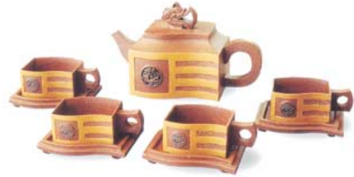
중국 자사호 작가 서준(徐俊) 씨의 작품.