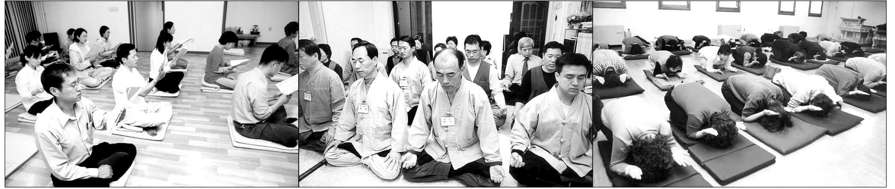
<불자 수행 프로그램 현황 조사 보고서>는 불교 수행이 다양화, 대중화 되고 있음에도 프로그램의 체계화가 필요하다고 진단했다. 왼쪽부터 금강경독송회의 독경, 우곡선원의 참선, 범왕정사의 절하기.

역겁의 업장이 녹고, 다성의 습, 악기가 다하고 악연이 단절되고, 삼독 번뇌가 멸진되어, 마음이 불신의 빛깔처럼 여쁨 한 낮 태양 속 빛처럼 되어, 삼천대 천세계의 모든 부처님의 위신력을 입어, 자기 불신을 얻고, 청정법신까지 갖추게 되면 이제 영겁을 환희 자재인 붓다의 삼매, 적정삼매를 수용합니다. 그러면 미래제가 다하도록 청정 '빛'이기에, 죽을 수 없습니다. 여기가 완전 초월, 대 열반입니다. 삼계의 범왕입니다. 합사의 신통, 지혜, 자비 모두를 다 갖추십니다.