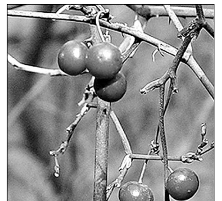
수은 중독을 풀어주는 청미래덩굴.