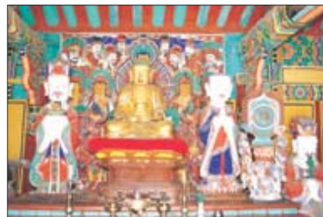
업경대가 있는 명부전 내부.