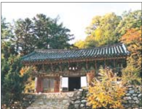
윤장대가 모셔져 있는 대장전(보물 제145호).