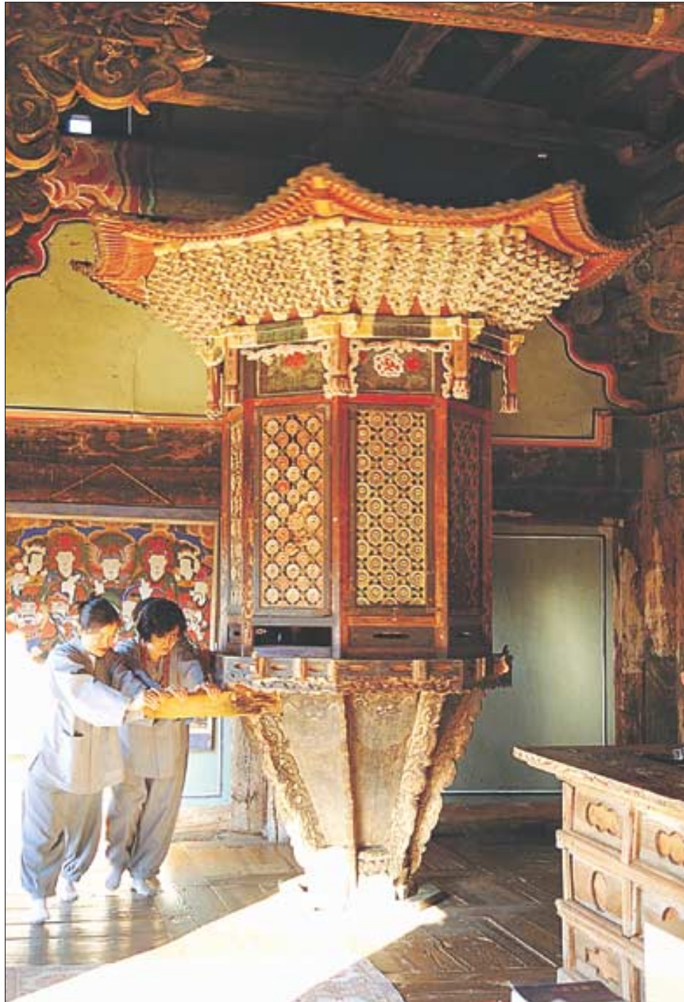
윤장대(보물 제684호)를 둘러싼 경전을 읽는 것과 같은 공덕이 있다고 한다. 용문사에는 윤달을 앞두고 윤장대를 둘러싼 불자들의 발길이 이어지고 있다.

“용문사에 도착하려면 얼마나 더 가야 할까.” “조금만 더 가시면 됩니다. 처사님도 윤장대 둘러 오셨소?”