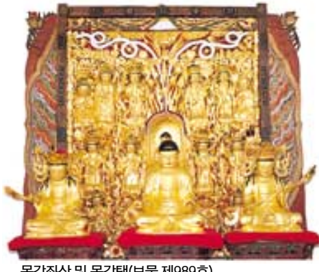
목각좌상 및 목각탱(보물 제989호).