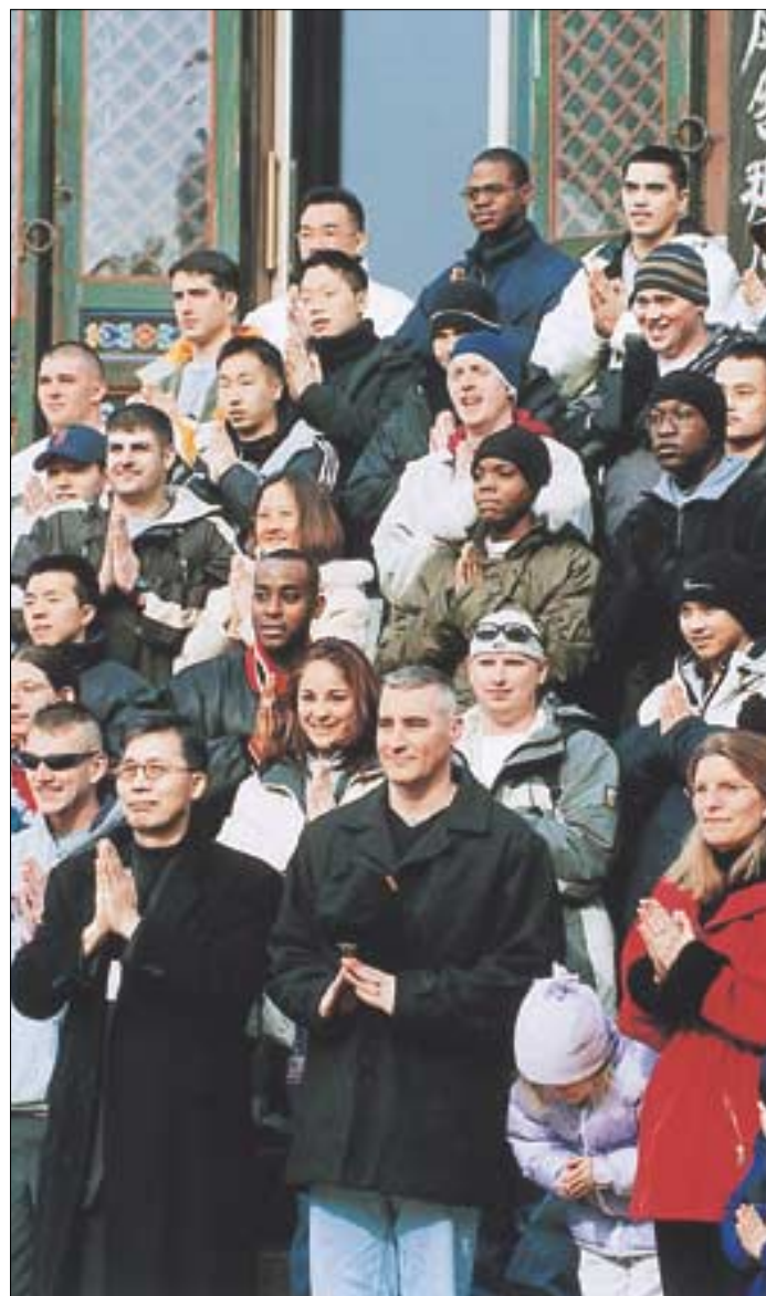
미8군 장병 100여명 봉은사 탐방

미8군 소속 장병 100여명과 그 가족들이 한국 불교를 배우기 위해 2월 13일 이른 아침 서울 봉은사를 찾았다. 국제포교사회 인내를 받으며 대웅전, 탑, 미륵대불 등을 둘러보고 불교의 인사법인 합장도 배웠다.