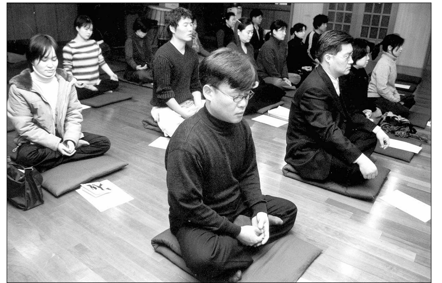
매주 목요일 저녁 묘원법사의 지도로 심념처를 수행하는 동산불교청년회 회원들.

“비물질인 마음을 알아차리는 것이 뜬 구름 잡는 일로 비칠 수도 있는데요.” “마음을 비물질이라서 분명하게 감지되지 않기 때문에 수(受), 느(觸), 상(想), 행(行), 행동을 통해서 알 수 있습니다. 마음이 수, 상, 행을 일으켰기 때문에 그것을 일으킨 마음을 안다는 것은 뿌리를 알아차릴 수 있는 기회로서 수행자에게는 소중한 방법입니다.” “마음의 어떤 특성이 깨달음을 가능하게 하는가요.” “마음은 순간적으로 일어났다가 순간적으로 사라지는 특성이 있습니다. 어떤 하나의 마음이 길게 지속되는 것이 아니고 순간 순간 서로 다른 마음이 계속해서 일어났다가 사라지는데 항상 뒤에 일어난 마음은 새로 일어난 마음입니다. 순간 순간의 마음이 사라지고 그것을 일어나게 하는 마음은 조건이지 나라고 하