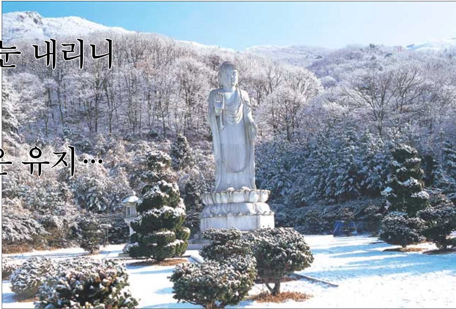
대웅전 뒤로 멀찌감치 떨어진 산자락에 석불상이 머리에 흰 눈을 이고 있다. 그 아래로 활엽수들도 가지마다 눈꽃을 피웠다.