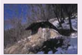
도솔암 토굴과 굴참나무 겹질.