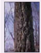
만세루 전나무숲 (왼쪽)과 어실각 향나무(아래).