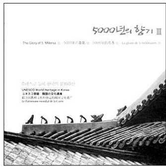
5개국어로 제작된 '5000년의 향기 III' 유네스코에 등록된 한국의 세계문화유산을 담고 있다.