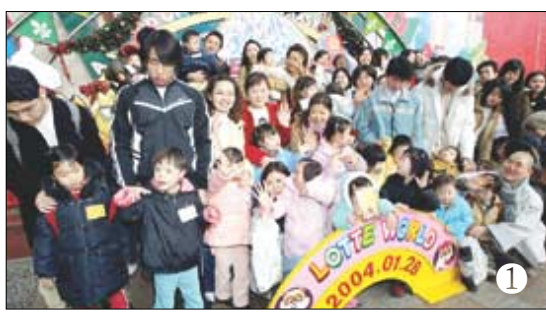
① ‘웃어요 사진 찍습니다.’ 상락원 대식구들이 손을 흔들고 있다. ② 롯데월드에서 상락원 유모차 부대가 떴다.