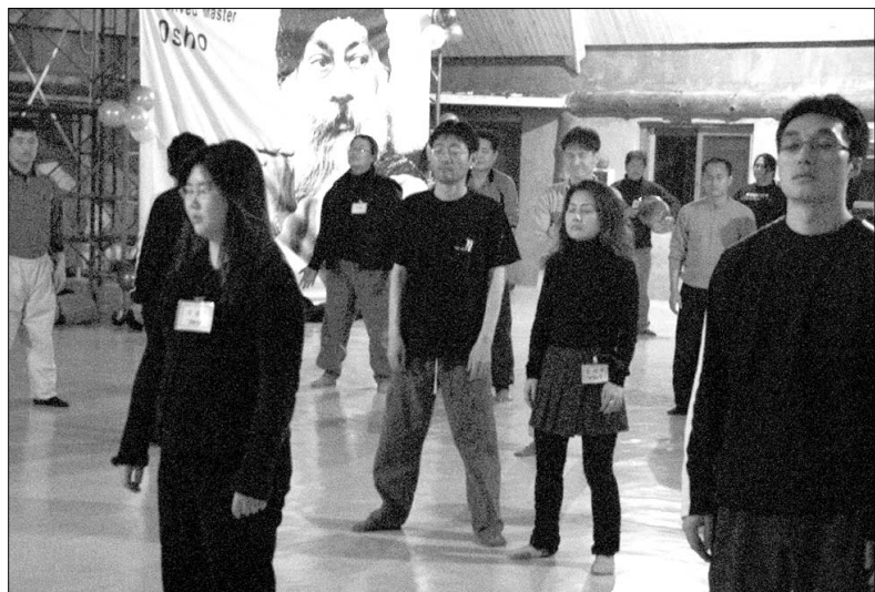
'삿상' 과정 중 침묵을 통해 스승과의 교감을 시도하는 참가자들.

그러했던 오쇼 명상이 부활의 계기를 맞았다. 국내의 산아신(라즈니쉬의 제자들)을 비롯한 오쇼 매니아들이 OSKA (Osho Sannyas Korean Association: 약칭 오스카)를 설립, 오쇼 관련자들을 아우르는 국내 최초의 축제를 기획했다. 오쇼의 열반일(1월 19일)을 기념해 마련된 이번 축제에는 국내의 오쇼 관련자 70여명이 참가해 나눔의 시간을 가졌다. 강원도 원주 파라미 명상원에서 1월 17-18일 양일간 진행된 행사의 현장 속으로 함께 들어가 보자.