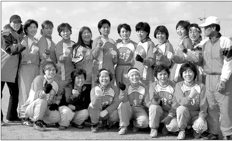
마산 삼학사 축구단원들이 9일 새해 첫 훈련에 앞서 화이팅을 외치고 있다.