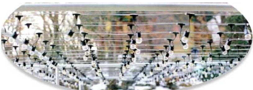
* 시공된 연등용 전선 케이블 *