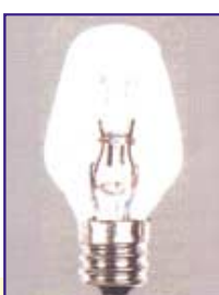
기존 필라멘트 전구용 연등