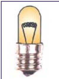
기존 필라멘트 전구용 인등