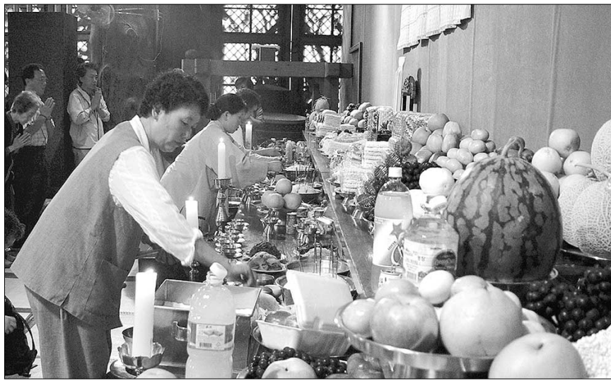
◇ 조계사에서 불교식으로 차례를 지내는 모습.

유교식과는 달리 병풍이나 위패, 사진 등은 상황에 따라 제외해도 무방하지만 위패를 쓸 때는 '선업부 곡산후인 연공제운영가(先嚴父谷山後人 延公濟胤靈駕)'나 간단히 '선업부○○영가(先嚴父○○靈駕)' 혹은 '선자모○○영가(先慈母○○靈駕)', '고조할아버지 영가' 할아버지 영가' 등으로 쓰는 것이 바람직하다. 이 정도면 훌륭한 불교식 차례상이 완