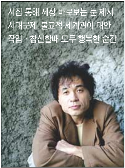
시집 통해 세상 바로보는 눈 제시 시대문제, 불교적 세계관이 대안 작업·참선할때 모두 행복한 순간