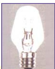
기존 필라멘트 전구용 연등