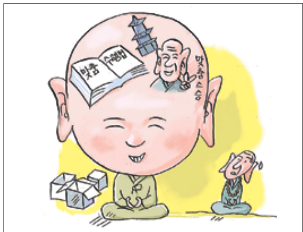
자본주의 도전... 종교 상품화