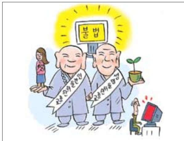
인터넷, 불법의 파괴자인가

오늘날 우리는 다양한 종교가 공존하는 다종교 시대에 살고 있다. 이 같은 다종교 사회에서는 종교의 사상적 편견으로 인한 아집과 독단이 심화되어 종교간의 갈등이 초래되기 쉽다. 지난 역사 속에서 종교가 있는 곳에 대립이 함께 했으며 종교가 다르다는 이유로 살육이 자행되기도 했다. 21세기에 접어들어 지금도 세계의 35개 지역에서 분쟁이 지속되는 등 종교간의 마찰과 대립은 그치지 않고 있다. 9.11 테러에 연이어 아프가니스탄 전쟁과 이라크 전쟁을 거치면서 종교간 불신과 국가간 갈등의 골이 더욱 깊어졌다. 이러한 현상이 지속된다면 종교가 인간 삶의 지혜나 기쁨을 제공해주지는커녕 대립과 투쟁의 원인이 될 수도 있으며, 이로 인한 일반인들의 종교에 대한 회의감도 증가될 수밖에 없다. 종교를 둘러싼 가장 큰 문제 중의 하나는 종교에 대한 열린 논의가 이루어지지 않는다는 것이다. 이제 종교간의 배타적 대립과 미움을 종식시키고 대화의 원리와 방법을 모색해야 한다. 이러한 전제 하에서 자신의 교단이 얼마나 독자성을 가지고 그 가르침을 넓혀갈 수 있을지를 탐색해야 할 것이다. 역사상 '비폭력과 무저항'을 실천해 온 불교가 종교간의 갈등을 저유하고 화합의 처방을 내릴 수 있기 위해서는 종교분쟁에 대한 연구와 적극적인 중재 노력이 필요할 것이다.