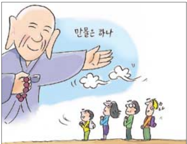
종교성 상실의 시대

자본주의는 종교수행에 접근하는 방식에도 커다란 영향을 미치고 있다. 자본주의 사회에서 '소비자'로 성장한 우리는 종교를 '소비'하려는 인식 또한 성장했다. 종교전통이 소비자의 상품이 되는 시대로 진입한 것이다. 달라이 라마의 제자이자 스라바스티 사원의 설립자인 들텐 최원은 "가장 적게 지불하고 가장 많이 가지려 하는 우리의 소비성향이 그대로 종교수행에도 드러나고 있다"며 "소비자들은 가장 수승하게 깨달은 스승과 가르침을 구매하기 위해 이곳저곳을 기웃거리며, 실증이 나면 곧 색다른 수행법을 찾아 나서게 된다"고 말한다. 중앙승가대 불교사회과학연구소 박수호 선임연구원은 불교계의 외적 환경변화로 종교의 시장화와 종교 콘텐츠의 상품화를 지적한다. 여러 종교 중에서 하나의 종교를 선택하는 것이 '종교의 시장화'라고 한다면, '종교 콘텐츠의 상품화'란 여러 종교의 콘텐츠를들 중에서 자신의 기호에 맞는 내용들을 골라 모아 자신만의 종교생활을 구축하는 것을 의미한다. '건강'에 대한 욕구가 최고조에 달한 요즘, 인간의 건강과 잠재력 개발을 위한 각종 수련법과 값비싼 종교용품들이 난립하는 것도 이러한 현상과 무관하지 않다.