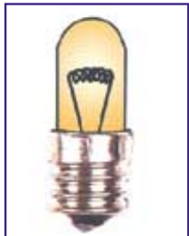
기존 필라멘트 전구용 인등