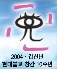
2004 · 갑신년 현대불교 창간 10주년

끊이지 않는 종교전쟁과 현대인의 필수품으로 자리 잡은 인터넷의 폐해, 물질만능주의의 만연에 따른 종교성 상실과 종교의 상품화 등 불교가 직면할 문제점들과 더불어 불교는 미래사회의 변화된 환경에 어떻게 대응해야 할지 알아본다.