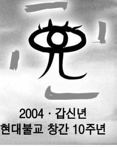
2004 · 갑신년 현대불교 창간 10주년

다. '문화'란 그 시대를 움직이는 원동력이다. 그 안에 불교가 있고, 거기에 우리가 찾아야 할 가치가 있다. 그런 잠재력을 보유하고 있는 불교의 전통과 문화. 서구에서, 인터넷에서, 그리고 우리의 문화 속에서 불교가 내일의 희망이 될 수 있음을 보여주고 있다.