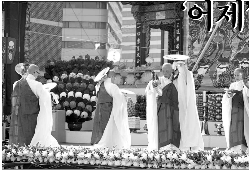
◇ 전통불교의식인 영산재. 최근 정부로부터 국가 중요무형문화재 지정을 받으면서 불교 전통 문화로 확실히 자리매김이 됐다.

한국불교의 수행·문화 전통은 서구에서도 인정하듯이 인류의 정신문화를 채워 줄 수 있는 보편적인 사상으로 평가받고 있다. 그럼에도 불구하고, 우리는 정작 이 점을 과소평가하고 있다. 이런 것이야말로 불교가 우리 사회의 정신적 자양분이 되는데 걸림돌이 된다. 불교가 이 시대의 종교로서 역할을 제대로 할 수 있기 위해서는 한국불교의 수행·문화 전통을 올바르게 발전·계승하는 것이 중요하다. 그