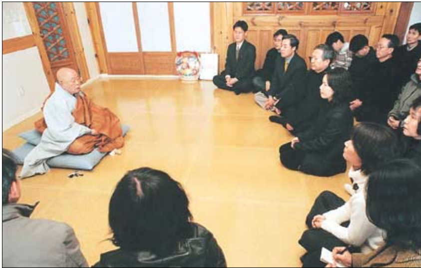
◇ 매우 엄숙하고 진지하게 조계종 정종 법전스님의 법문을 듣는 애독자들과 본사 직원.

질 수 있는 일은 아니지. 부처님 말씀처럼 실천공행하며 살 때 가능한 이야기야. 예컨대 북 많이 달라고 억만금을 짜 들고 해인사 법당에 찾아와 불공을 한다고 해서 그것이 진정 참불자가 되는 것이고, 부처님에게 복을 받아 가는 것은 아니야. 내가 살고 있는 주변, 여러 분들이 살고 있는 서울 시내 구석구석을 찾아다니며 남을 위해 봉사하고, 서럽고 외로운 사람, 병들고 힘없는 사람들을 위해 내 마음과 내 가진 것을 나누어 주는 것이 진정한 불공이지. 그런 삶을 산다면 그야말로 성불은 하지 못해도 참 불자라 부를 수는 있는 거야. 여러분들이 참 불자가 되는 길을 물