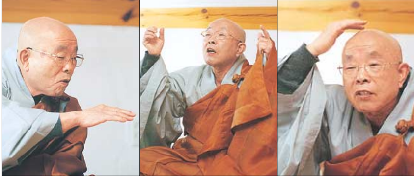
◇ '절구통 수좌'란 애칭으로 끊임없는 정진의 기풍이 대변되는 법전스님은 평생 '무'자 화두를 들고 수행했다.

화두라 말할 수 있어. 조계종의 중흥 조사 중의 한 분인 고려말엽의 태고 보우 스님은 처음에 "모든 존재는 하나로 돌아간다면 그 하나는 어디로 돌아가는가?"라는 화두를 참구하여 깨달음을 얻었다고 해. 뒤에 중국에 들어가 석유청공스님을 만나게 돼. 석유청공스님은 입제스님의 법손으로 알려진 인물