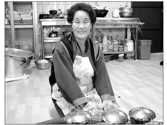
◊달마사실상화보살이 불기를 닦고 있다.

실상화 보살 이지만 지난 2002년부터는 금강경 사경 등 경전공부도 시작했다. 앞으로는 자기공부에 열중하며 젊은 불자들에게 봉사하는 마음가짐, 사찰봉사의 요령 등을 가르치고 싶은 마음에서다.