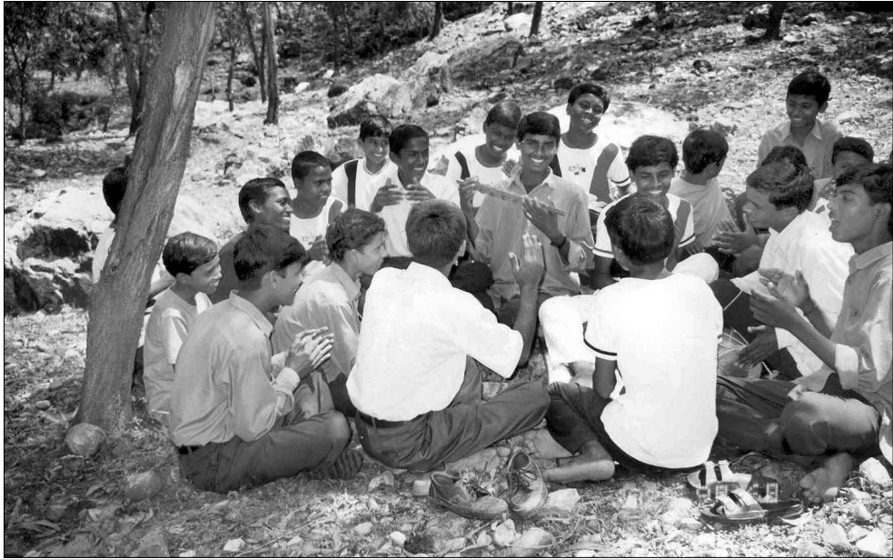
◊설립 10주년을 맞는 수자타아카데미 야외수업 모습.