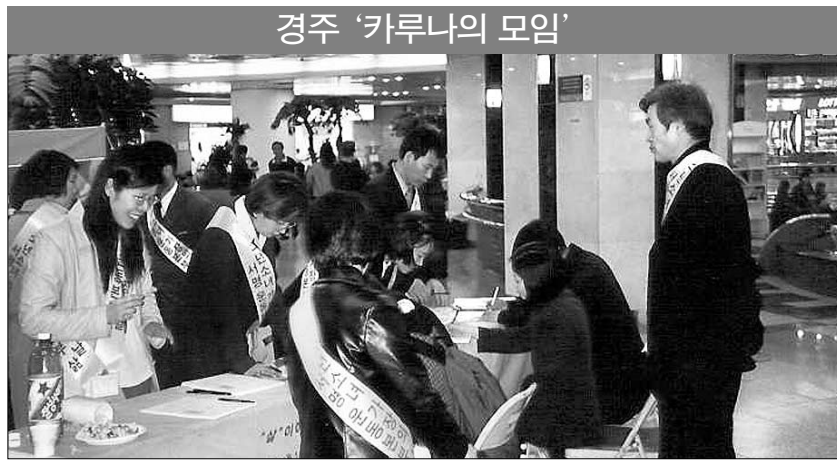
◇'소년소녀 가장의 날' 지정을 위한 백만인 서명운동을 펼치고 있는 카루나의 모임 회원들.

다. 이들은 지역별로 봉사팀을 별도로 구성해 지역의 현황을 수시로 체크하는 동시에, 밀반찬 준비·빨래 등의 노력봉사와 후원금 보시 및 모금운동에도 적극적으로 나서고 있다. 또한 11월 1일을 '소년소녀 가장의 날'로 지정하기 위해 100만인 서명운동을 벌이기도 했다. (054)741-0800 김상재 기자