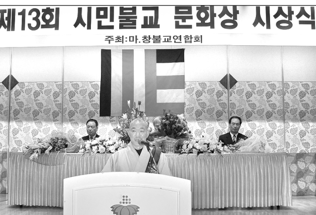
◇창원 인터내셔널 호텔에서 봉행된 제13회 시민불교문화상 시상식 모습.

이번 행사에는 40여명의 자원봉사자들이 함께 했으며, 이날 담겨진 김장은 소외된 이웃 3백 세대에 전달됐다. 천미희 기자