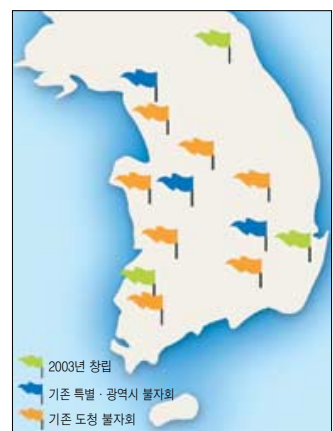
◇도·광역시청 공무원 불자회 분포도.

면 충남(6개시·9개군), 충북(3개시·8개군), 제주(2개시·2개군), 광주(5개구) 등은 1곳(공주, 청주, 제주, 서구청), 울산(1개군·4개구), 인천(8개구·2개군) 등은 단위 기관불자회가 아직 없는 것으로 파악