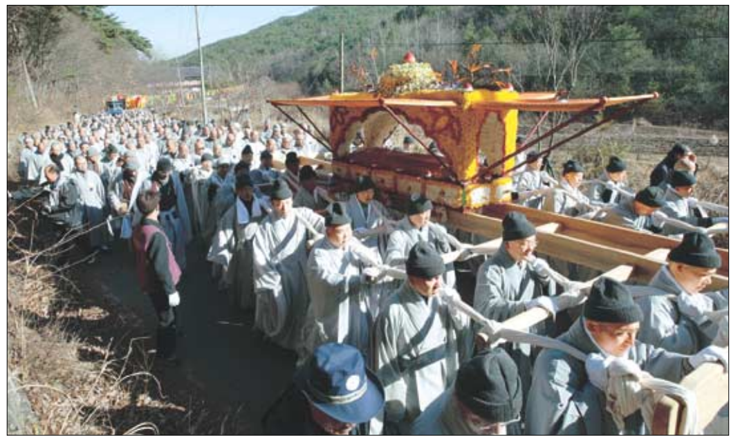
"빛으로 다시 오소서" 12월 4일 원적에 든 월하스님 영결식과 대비식이 10일 통도사에서 조계종 종단장으로 열렸다. 영결식이 끝난 후 법구를 대비장으로 이송하고 있다. 권연기사연

조계종 총무원 집행부가 북한산 문제와 관련해 12월 12일 총무원회의를 열고 빠르면 다음주 중 최종 입장을 결정짓기로 했다.