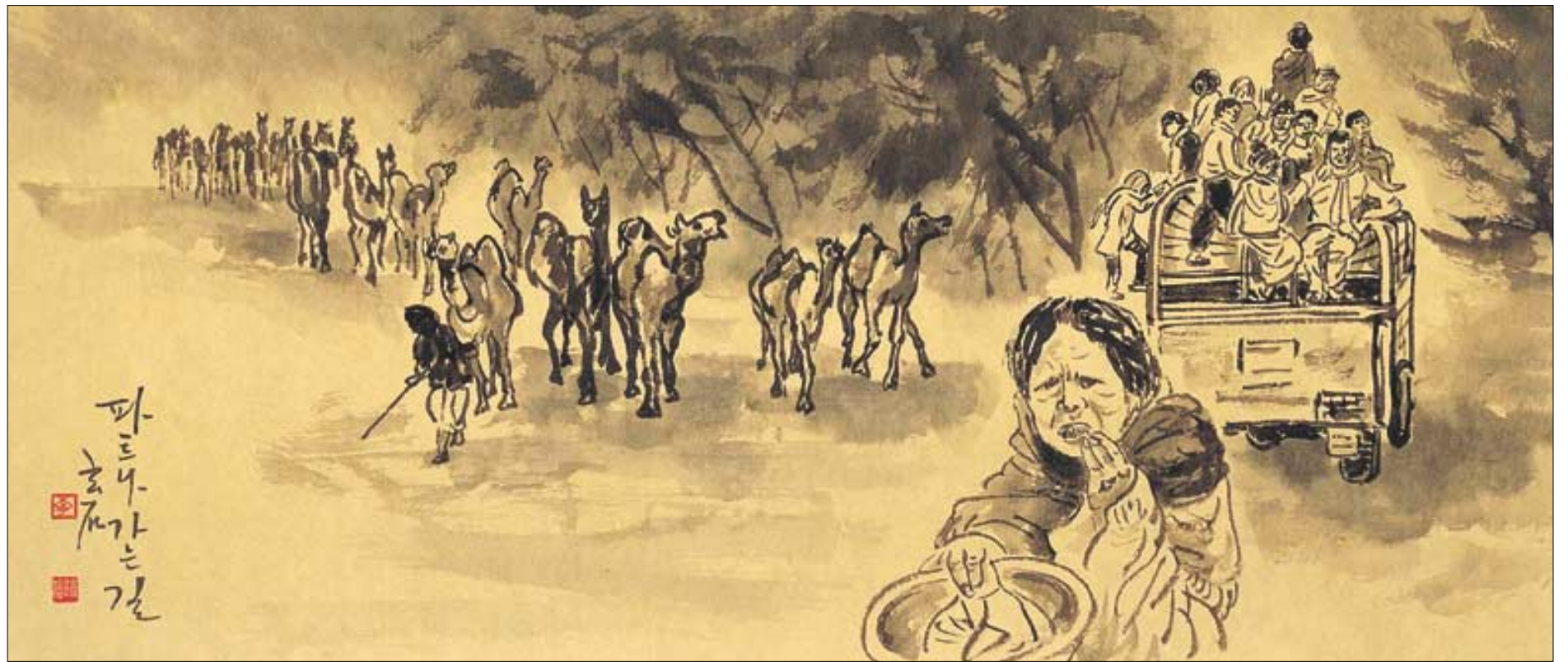
◇파트나 가는 길(94×41.5cm).