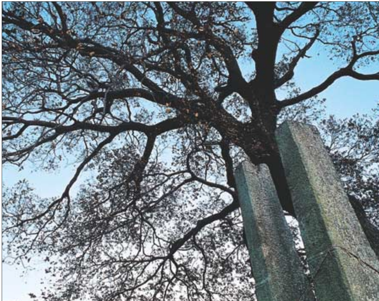
◇본업을 잇은 채 서낭당 나무와 함께 마을 사람들에게 복과 안녕을 빌어주는 당간지주.