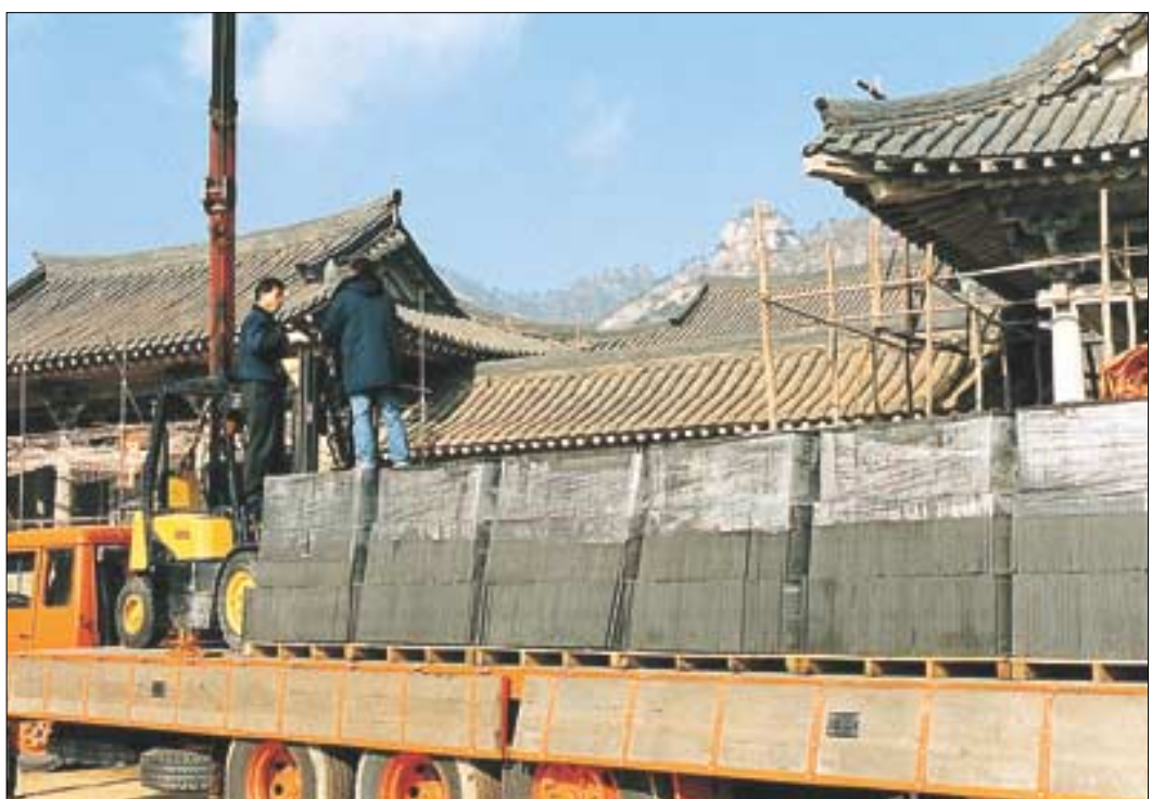
‘통일 기와’ 영통사 도착

천태종은 12월 1일 개성 영통사 복원을 위한 ‘통일기와’ 3천여 6만장을 전달했다. 영통사에 도착한 기와를 트럭에서 내리는 모습.