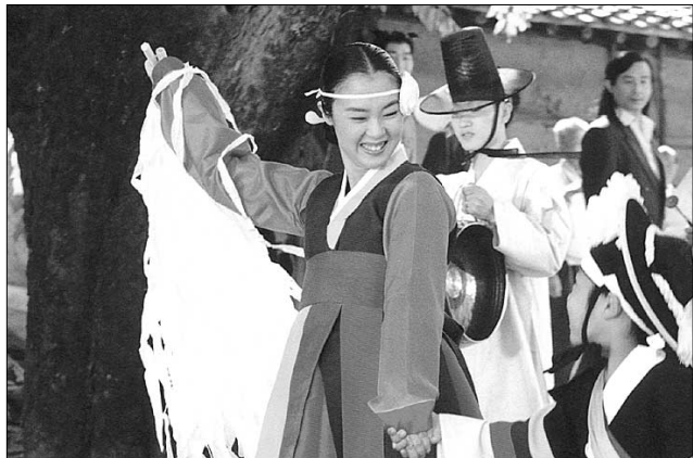
영화 '오구'에서 벌어지는 곳판은 화해와 소통의 장이다.

'산오구'의 줄임말인 '오구'라는 제목에서도 알 수 있듯이 이 영화의 모티브는 신령나는 곳판이다. 영화 곳곳에서 등장하는 황씨 할매의