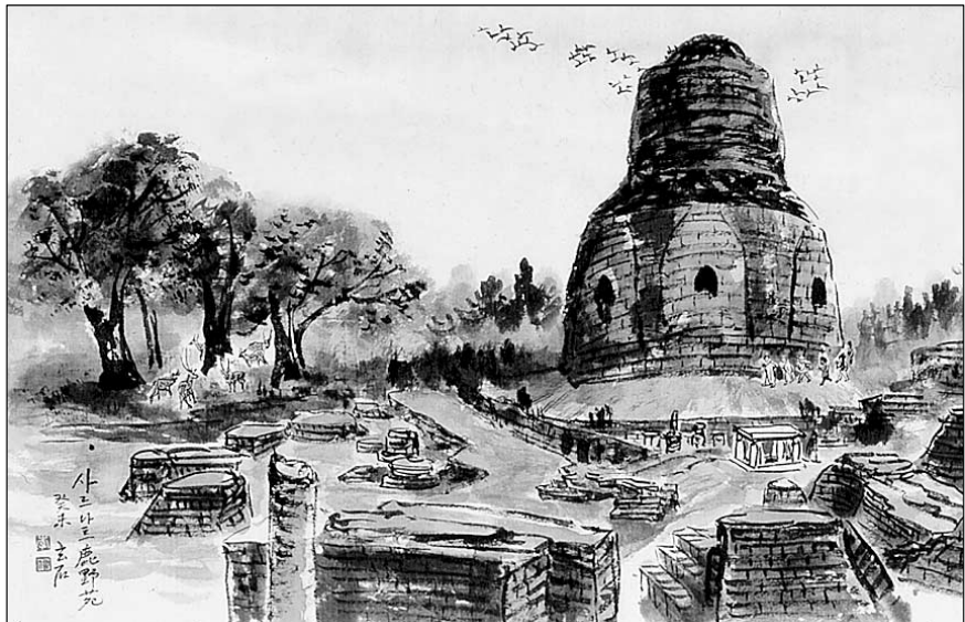
부처님의 초전법륜지인 사르나트 복아원.

인도의 불교 성지가 한국 전통 수묵화의 기법으로 한지 위에 다시 태어난다.