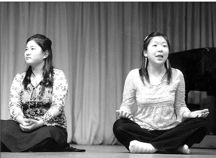
◇성신여대 학생들이 불교의 모시, 애어, 이행, 동사 등의 사법법을 주제로 연극을 공연하고 있다.