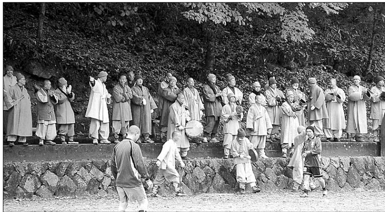
◇해인사에서는 매년 단오날 산중 체육대회를 연다. 이 대회의 하이라이트는 단연 축구대회. 스님들의 축구에 대한 열정은 최근 운동장을 잔디 구장으로 바꾸는 결실을 거두었다.

"최신형 모델 40화음 핸드폰으로 바꾸고 겪은 일이다. 새 핸드폰을 보면서 기분이 좋아 신도들 앞에서 싱글벙글하고 있을 때 전화가 울리는데 벨소리 때문에 기절할 뻔 했다. '어보- 전화 받아요-'."