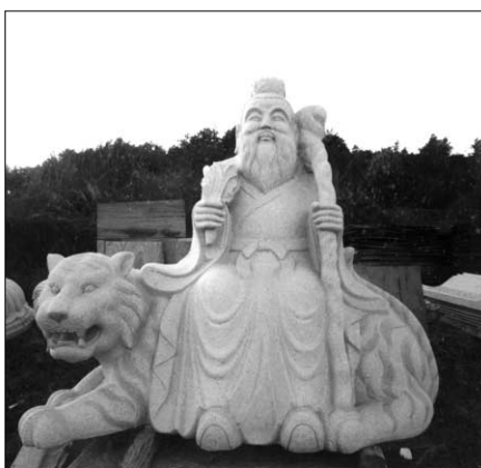
[천룡정사에 조성할 호법신신]