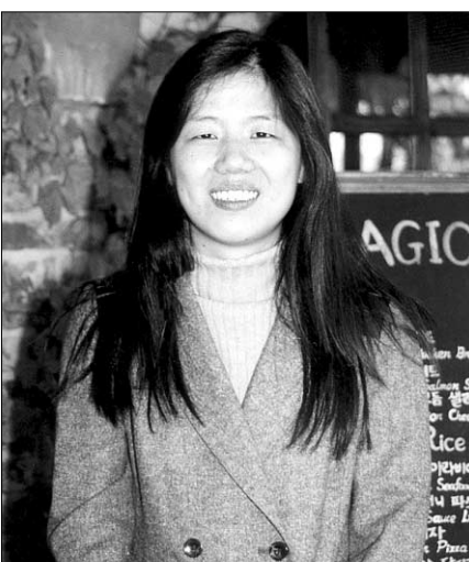
오소요 라즈니쉬 이수람에서 수행중인 프라폴라.