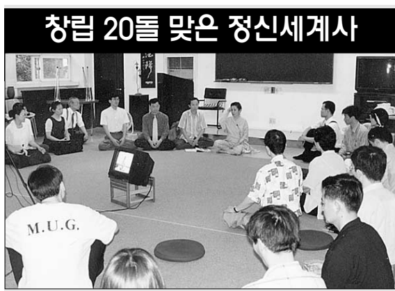
정신세계원의 선무(禪舞) 강의 장면.

"명상의 목적은 심신의 건강과 안정으로부터 깨달음을 지향합니다. 명상 입문자들이 공부를 하다보면 자연스럽게 불교를 알게 되고 궁극적인 깨달음을 얻기 위해서 부처님의 가르침이