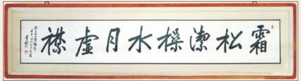
◁봉은사 조실 석주스님 휘호.

민가협, 나눔의집, 소책새마을 등과 중앙승가대학, 실상사 등 스님들이 정진하는 곳에 공양미를 보시하고 있습니다.