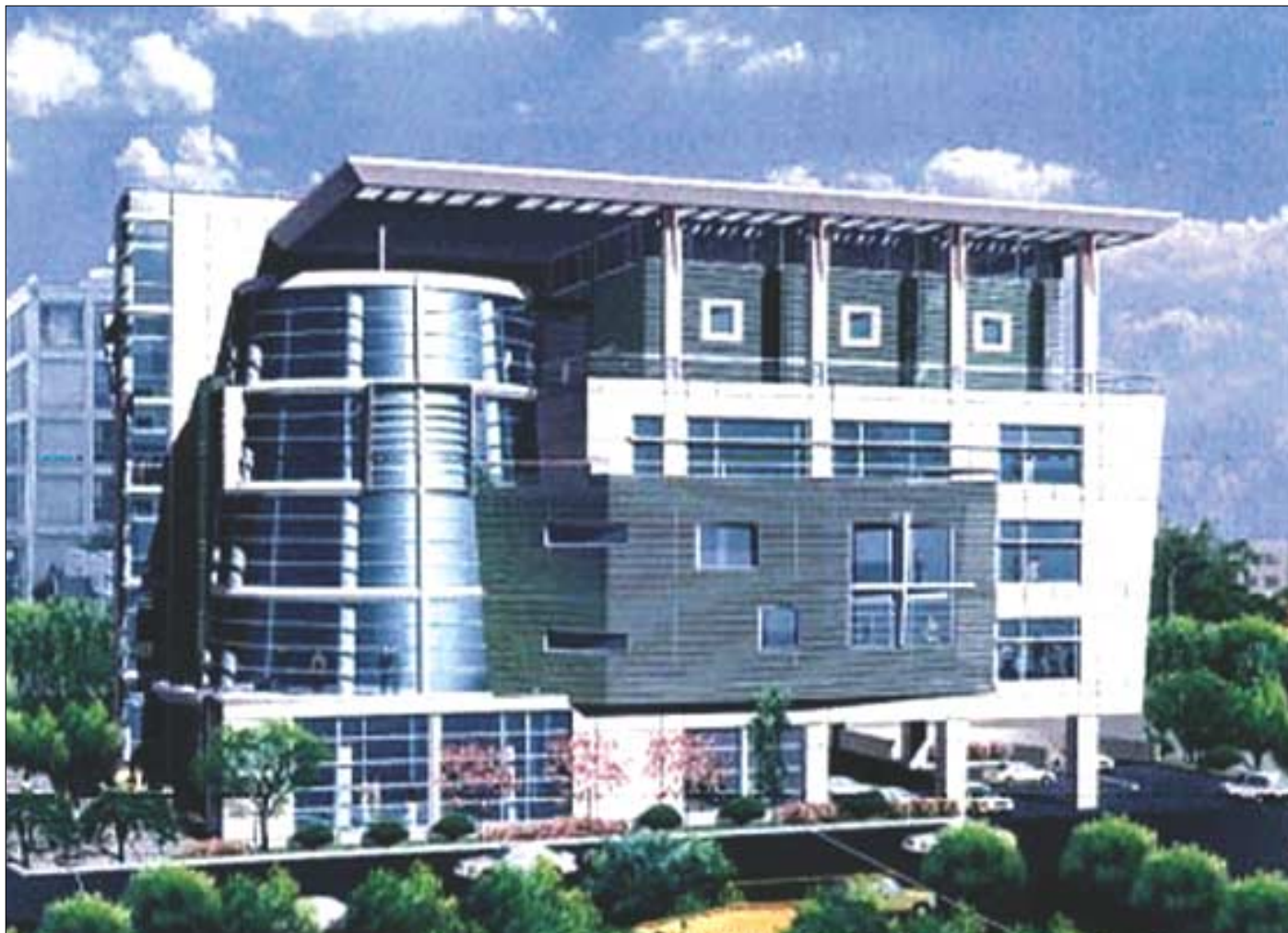
◁강남지역 청소년 포교에 앞장설 역삼청소년수련관.