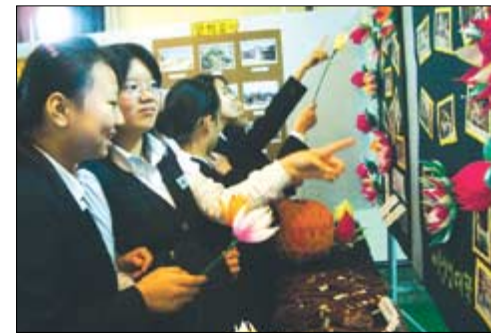
북서울 중학교 학생들이 '불교학생회' 전시코너에서 즐거워하고 있다.

문화재청은 지정사유에서 “삼각산은 인수, 백운, 만경의 세봉우리가 지니는 신비로운 자태와 영산으로서의 가치뿐만 아니라, 삼국시대부터 우리 선조들이 제사를 지내고 도를 닦던 민족사와 문화사적 가치가 큰 곳”이라고 밝혔다. 주왕산에 대해서는 “백악기 화산암류로 구성된 자연경관이 뛰어나고 산봉우리마다 주왕의 전설이 얽혀 있는 등 명승으로서의 가치가 크다”고 설명했다. 또 진안 마이산의 경우 “탑처럼 우뚝 솟은 모양의 경관적 가치와 풍화표면에 수많은 풍화혈이 발달한 학술적 가치가 큰 산”이라며 지정사유를 밝혔다. 오유진 기자