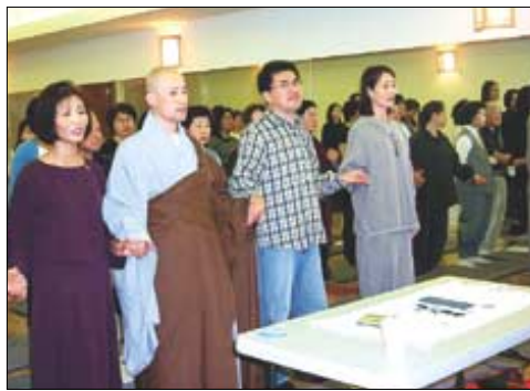
수련회 참석자들이 손을 잡고 마음을 나누고 있다.