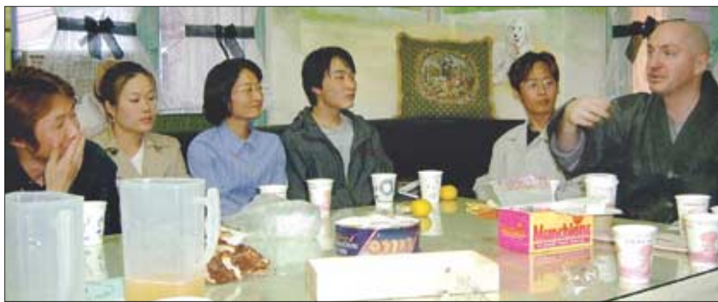
회계사 청년회원들이 현각스님과 함께 불교교리와 수행에 대해 얘기를 나누는 모습.

“저희는 함께 수행하는 도반이에요.” 화계사 청년회 40여명의 청년들이 이같이 말하며 환히 웃어 보였다. 10월 25일 대학로의 한 카페에서 갖은 '현각스님과 티타임'.