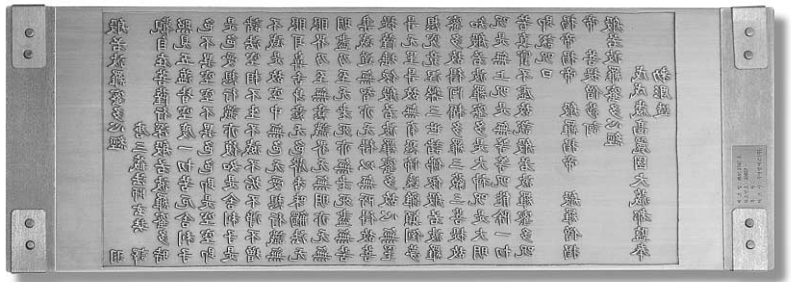
▲ 최고의 품질로 수명 만년이상인 (주)통산에서 생산된 인청동과 우연MS(주)의 기술로 조성된 팔만대장경