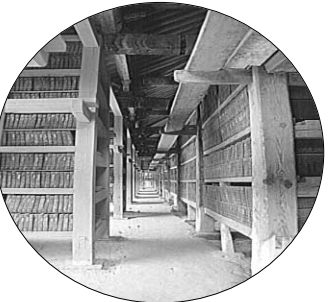
▲ 유네스코 세계문화유산인 해인사 팔만대장경

국운융창, 국민대화합, 조국통일, 세계평화를 위해 인청동판(靑銅板)으로 복원 조성합니다