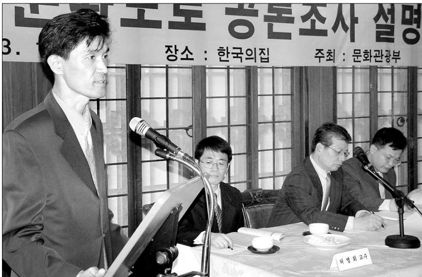
◇10월 21일 한국의 집에서 열린 공론조사 설명회에서 환경문제가 공론조사 대상에 적합한지 여부를 놓고 설전이 벌어졌다.

법장 스님은 10월 21일 총무원장실에서 이창동 문화부 장관과 만나 "북한산 문제는 대통령 공약이고 정치적 사안인데 그렇게 (공론조사로) 풀 문제가 아니다. 공정한 게임이 되어야 하는데 (공론조사는) 그렇지 않다"며 공약 이행을 거듭 촉구했다. 이 자리에 배석했던 총무부장 성관 스님과 기획실장 현고 스님은 "대안노선에 대해서도 정부가 기존 노선과 마찬가지로 정밀한 조사를 해서 구체적이고 명확한 근거를 제시해야 한다"고 지적하고 "노선재검토위의 최종 보고서가 참여 전문가 합의에 의해 정상적으로 나와야 한다"며 정부에 대한 불교계의 불신을 먼저 씻는 것이 문제해결의 선결조건임을 강조했다. 이 장관은 "공론조사 문제를 어떻게 풀어야 할 것인가에 대한 의제는 같이 만들어 갈 수 있고, 공론조사를 하더라도 백지상태에서 할 것이다. 그러나 대안노선 실효는 시간이 너무 많이 걸리기 때문에 공론조사를 하면서 함께 병행하는