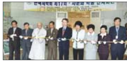
▷행사시작을 알리는테이프 커팅.

(신현철도예연구소 대표) 씨와 이정환 주유요 대표, 천한봉 문경요 대표 등 20여 다기 명장들의 작품 전시회를 비롯해 '차꽃 사진 초대전'이 선보였다. 선혜 스님이 준비한 '조선시대의 한국화에 나타난 한국의 다례' 그림전에서는 '오지연도중헌공다례도(羅池宴圖中獻供茶禮圖)'와 '오지연도중다연향도(茶宴圖)'와 '나한잔다도(羅漢煎茶圖)' 등 불화에 나타난 다례 유형을 엿볼 수 있었다. 이 밖에도 디자인서 서은주 씨는 차실에서 차를 마실 때 입을 수 있는 웃을 전시한 '우리 웃·차실 북식전시회'를 선보였다. ▲다례발표회=19일 오전 성신여대 잔디운동