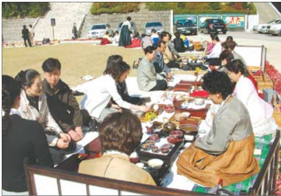
▷10월19일 성신여대 잔디운동장에서는 200여명의 차인이 모여 차 한잔을 나누는 두리차회가 열렸다.

창립 9주년을 맞은 한국차학회(회장 천병식)가 지난 10월 18-20일 제17회 국제 차학술 심포지엄을 개최했다. 한국차학회가 주최하고 성신여대 문화산업대학원 예절다도학과가 주관한 이번 행사는 학술심포지엄 뿐만 아니라 '한국의 차례법 학술발표회'와 그림전 '조선시대의 한국화에 나타난 한국의 다례', '한국 명장들의 차기구 전시회', '차꽃 사진 전시회', 두리차회 등의 행사가 펼쳐져 다양한 문화교류의 장이 마련됐다. ▲학술심포지엄=18일 오전 9시, 이른 시간이지만 성신여대학교 수정관 4층 대강당은 차인들로 가득 찼다.