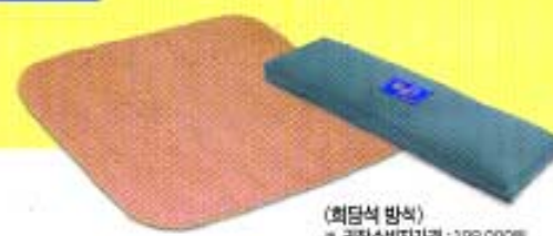
(희담석 방석) * 권장소비자가격: 138,000원 * 색상: 연두색, 실구름