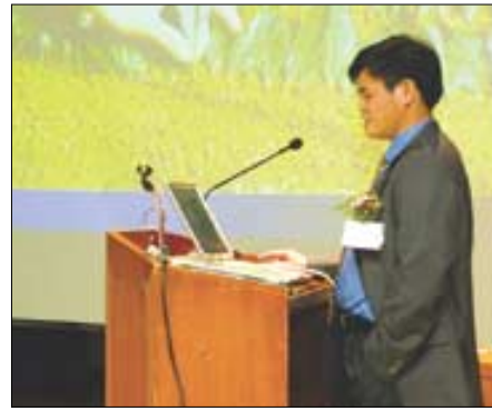
▷중국 절강대학 리양 옹 교수가 '중국 차산업 발전' 논문을 발표하고 있다.

장에서는 따뜻한 햇살 아래 차 한잔을 나누는 두리차회가 열렸다. 성균관대학 생활과학대학원 생활예절 다도전공 차회와 예지원 차회 등이 참석한 두리차회에는 200여 명의 차인들이 모여 차 한잔을 나누는 시간이 마련됐다. 이어 오후 1시부터 특별무대에서는 이번 심포지엄의 가장 큰 특징이라 할 수 있는 '한국의 차례법 학술발표회'가 열렸다. 다양한 형태로 전해지는 차례법의 학술적 근거를 제시하고, 그 차례법을 선보임으로써 고유의 차문화를 정립하기 위해 마련된 이 발표회에서는 한국차문화학회의 규방다례와 한국다도협회의 조선사회규사다례, 한국차인연합회의 생활차례, 불교전통문화원 석정원차회의 풍류생활차례 등 6종류의 차례법이 발표되 눈길을 끌었다.