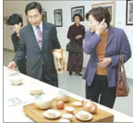
▷그림전과 다구전시회, 사진전이 열린 전시장은 시민들의 발길이 끊이지 않았다.