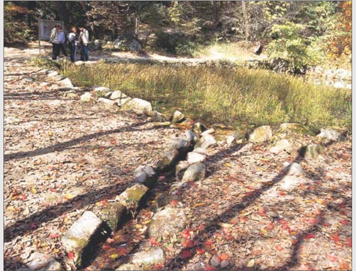
사찰생태연구소·현대불교신문이 함께 하는 108사찰 생애기행 (17) 오봉산 청평사