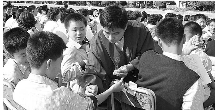
◆금정중 학생들이 교편사로부터 연비를 받고 있다.

반야심경 봉독, 성오스님 법문, 수계 의식 등의 순서로 진행된 이날 수계 법회에서 성오스님은 “계를 받아 지는 것은 부처님의 가르침을 적극 실천하겠다는 다짐이며 불제가 되는 첫걸음”이라며 “단 한가지