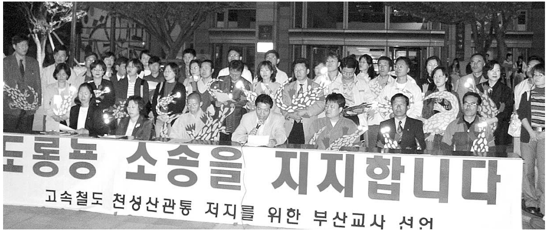
부산지역 교사 108명이 천성산을 살리기 위해 10월 17일 지울스님과 도룡농 소송 지지서명서를 발표했다.