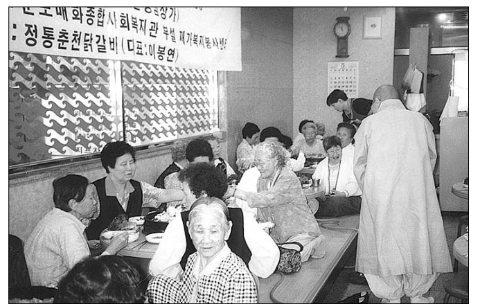
▷사진은 운불련 안양지역회원들이 올 봄에 지역 거주 독거노인을 초청, 경로잔치를 벌이고 있는 모습.

한국운전기사불자연합회 안양지역회는 상구보리 하회중생의 불교이념을 구현함을 물론, '달리는 법당, 거리의 포교사'로서의 참된 뜻을 가지고 1994년 7월 30여 명의 안양지역 거주 개인택시 사업자로 첫발을 내딛게 됐다. 안양지역회는 불교중흥에 앞장서기 위해 정기법회 수행생활을 통한 포교활동은 물론 캠페인사업으로 지역 주민들의 교통편의를 제공하고 있습니다. 또 장애인·독거노인 무료 수송, 생생명 찾기 운동, 환경운동에도 적극 참여해 나름대로의 부처님 자비사상을 몸소 실천하고 있습니다. 한국운전기사불자연합회 회원들이 대부분이었기 때문입니다. 그야말로 불교에 '불'자도 모르는 초짜배기 불자들이었습니다. 우선은 불교를 알아야 했습니다. 그래서 우리 불자회는 스님들의 법문부터 듣기 시작했습니다. 매일 지역 사찰을 돌며 법회를 꾸준히 봉행해 조금씩 불교를 알아가게 됐습니다. 이제는 답습하는 스님들에게 불교를 설명할 수 있을 만큼 됐습니다. 말 못할 어려움은 또 있었습니