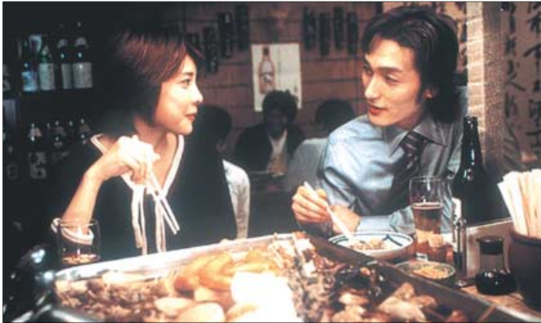
◇영화 '환생'의 한 장면.