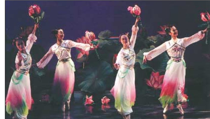
◇연꽃의 청정무용함을 현대 창작 발레극으로 표현한 무용극 '연화'.

든 4명의 무용수가 무대로 나와 '자성정심(自性淸淨心)'과 '염화미소'를 주제로 춤사위를 출날린다. 욕망이나 집착때문에 가려져 있지만 인간 누구에게나 순진무구한 본래 마음을 가지고 있다는 메시지를 현대 발레로 전해준다. 대만 까오슝(高雄) 시립 발레단이 특별 출연한다. 김주일기자