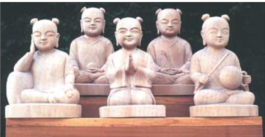
◇송근영 작, '문수보살의 다섯동자'.

불교대중화를 위한 '제10회 불교음악 한마당'을 연다. 성악가 정율스님을 비롯해 찬불가수 지연스님, 불가수 김흥국, 모더스 불교현악 4중주단 등이 연주한다. (055)747-0108